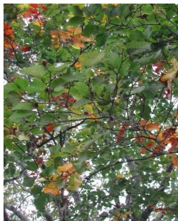
写真-13 ブナの結実状況