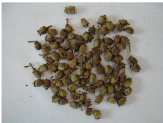
写真-12 マンサクの種子